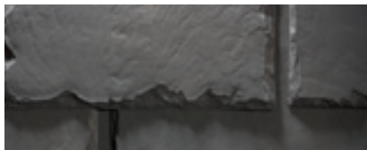
Mezcla de Federal Gray (Gris federal)