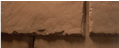
Mezcla de Cedar Brown (Marrón de cedre)