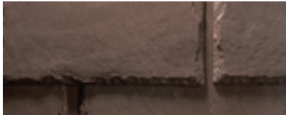
Mezcla de Chestnut Brown (Marrón de castaña)