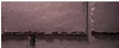
Mezcla de Mountain Plum (Ciruela de montaña)