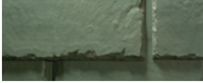
Mezcla de Earth Green (Verde de tierra)