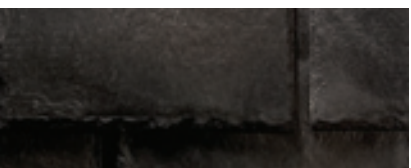
Mezcla de Black (Negro)

Avance en una nueva dirección donde la belleza acompaña fuerza y tradición encuentra innovación con un producto premio revolucionario del techado: Majestic Slate™. Fabricado por EcoStar®, el fabricante principal de productos de techo de alta inclinación, Majestic Slate combina los mejores materiales de hoy a un producto de techo exitante para el hogar y el negocio igual.