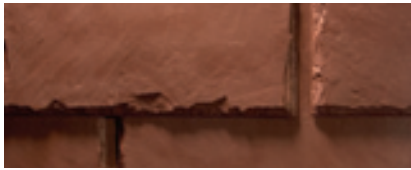
Mezcla de Red Stone (Piedra Roja)